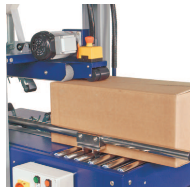
Automatsko podesavanje visine i sirine paketa