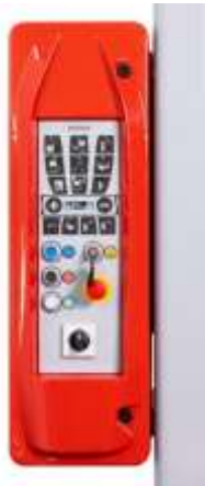
„X3“-Kontrolni panel “X3” CONTROL/ Korisnički interfejs - grafički tasteri sa membranom Operator Interface with graphic membrane keypad and 2.23” OLED DISPLAY