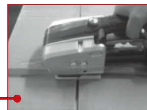
Odsecite višak trake povlačenjem ručice