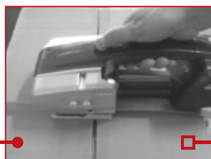
Pokrenite zatezanje trake