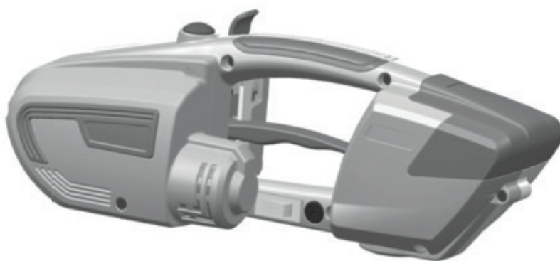
Dimenzije (L*W*H): L340*W130*H118mm

Ergonomska i kompaktna Najlakša na tržištu, samo 2,7 kg PP i PET traka za vertikalnu i horizontalnu primenu Brzina do 200 mm / s Sistem frikcionog varenja Baterija za punjenje Malih dimenzija Niski troškovi održavanja Litijumska baterija nove generacije