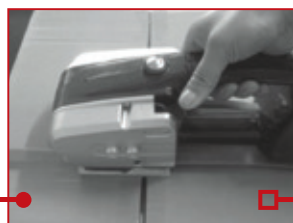
Polugom na apratu zavarite traku