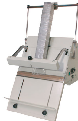
Slika 1. Mašina PANDINO 400 PD