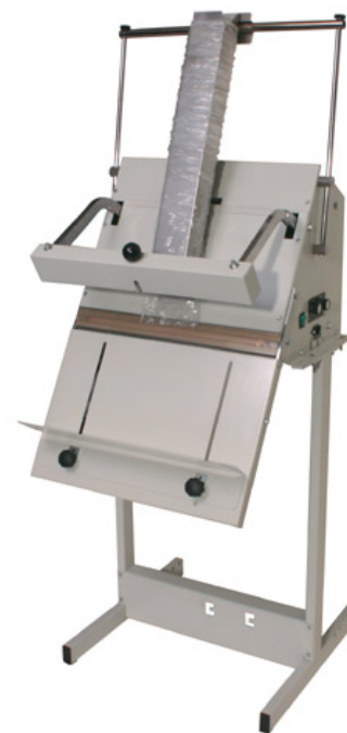
Slika 2. Mašina PANDINO 400 PD sa postoljem