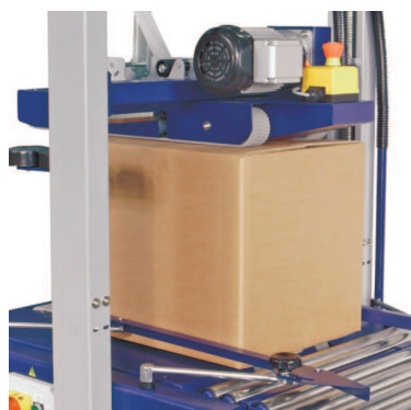
Rucno podesavanje visine i sirine paketa