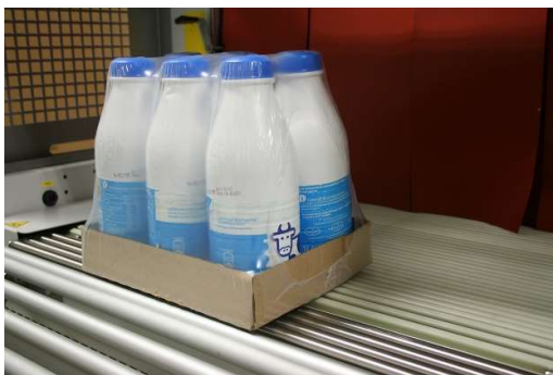
Prikaz pakovanja sa kutijom