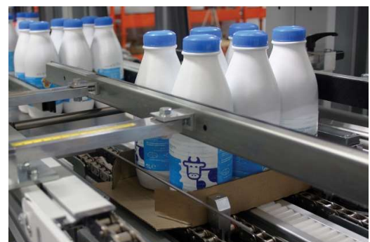
Prikaz zatvaranja stranica kutije