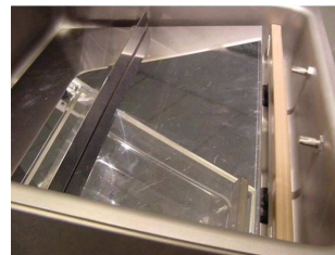
Slika 2. Postavljanje kose ploče unutar komore