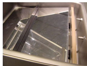
Slika 2. Postavljanje kose ploče unutar komore